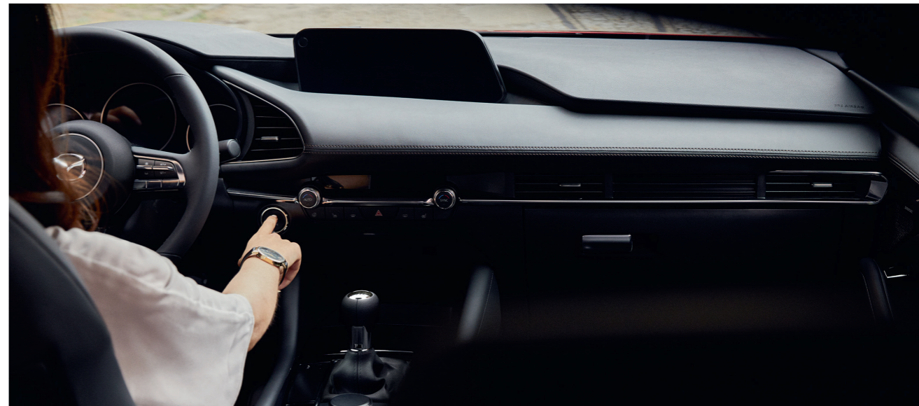
Nouvelle Mazda3 5 portes Sportline avec option peinture Métallisée Soul Red Crystal

Le caractère affirmé de la Nouvelle Mazda3 vous invite à découvrir son intérieur avant-gardiste axé sur le conducteur et à vivre une expérience de conduite incomparable. L'intérieur a été retravaillé et façonné à la main par nos designers pour garantir un niveau de confort optimal au conducteur et aux passagers. De plus, les technologies i-Activsense, le compteur numérique 7" et le nouveau système Mazda Connect couplé à l'écran 8.8" TFT visent à vous offrir une expérience de conduite inédite.