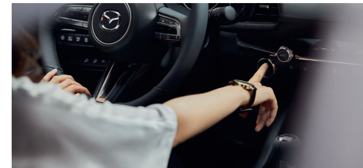
Volant et bouton « Start » avec cerclage chromé