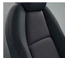
TISSU NOIR (MAZDA3, STYLE ET SPORTLINE)

**Seules les zones portantes des sièges (assise, dossier, renforts latéraux) sont revêtues de la garniture mentionnée.