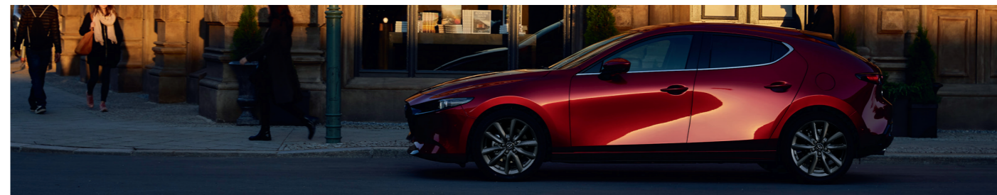
Nouvelle Mazda3 5 portes Sportline avec option peinture Métallisée Soul Red Crystal

Votre concessionnaire se tient à votre disposition pour plus de détails.