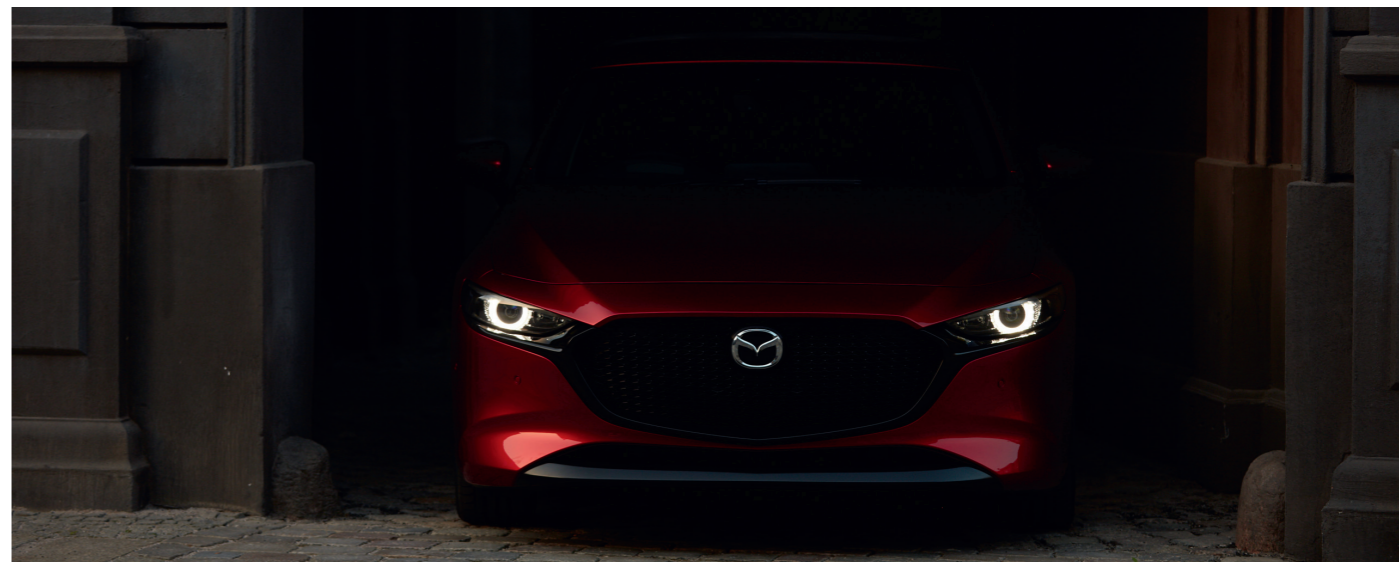
Nouvelle Mazda3 5 portes Sportline avec option peinture Métallisée Soul Red Crystal

*Tarifs TTC maximum conseillés hors option dans le réseau Mazda au 01/04/2019, sous réserve de changements. Pour toute information complémentaire, veuillez contacter votre Concessionnaire ou Réparateur Agréé Mazda.