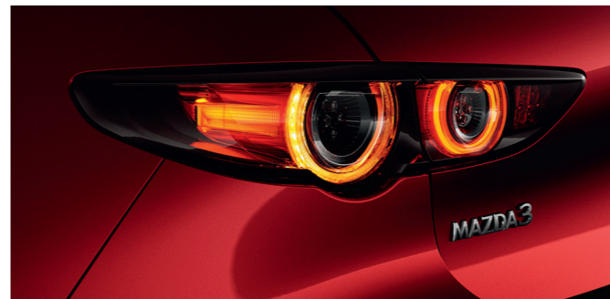
Signature lumineuse spécifique