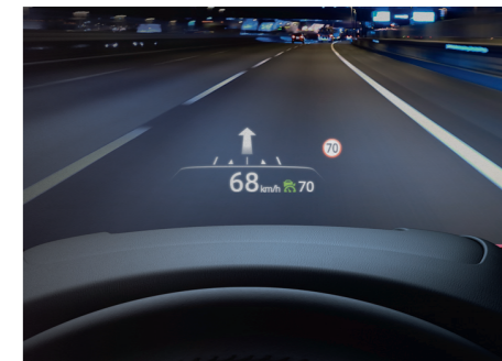
Affichage tête haute projeté (ADD)