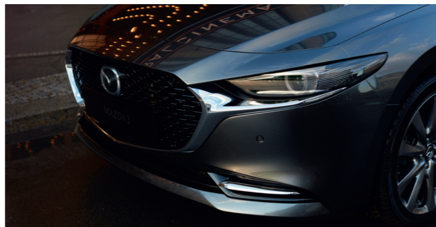
Nouvelle Mazda3 Berline Exclusive avec option peinture Métallisée Machine Gray (disponible en octobre 2019)