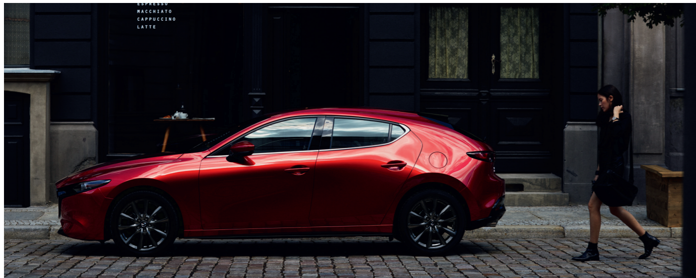
Nouvelle Mazda3 5 portes Style avec option peinture métallisée Soul Red Crystal