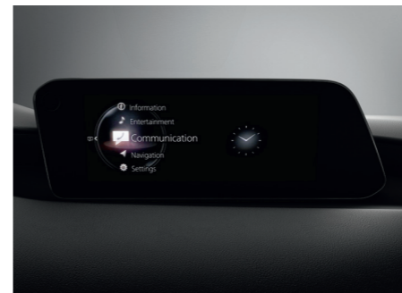
Système Mazda Connect avec écran couleur 8,8" TFT et système de navigation