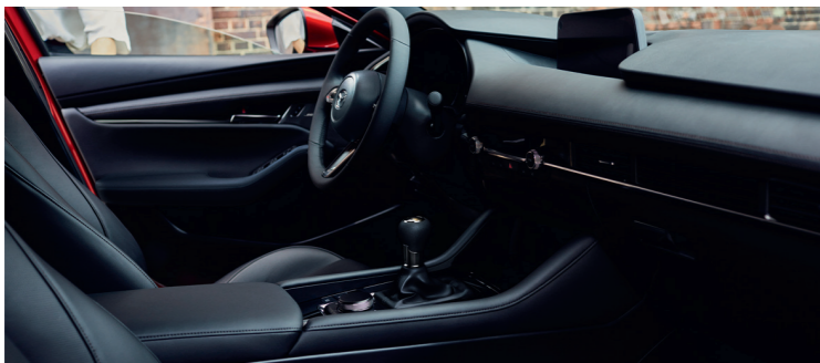
Nouvelle Mazda3 5 portes Inspiration avec option peinture Métallisée Soul Red Crystal