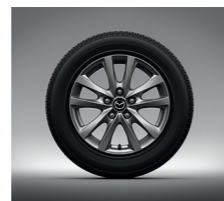
JANTES ALLIAGE 16" « SILVER » (MAZDA3)