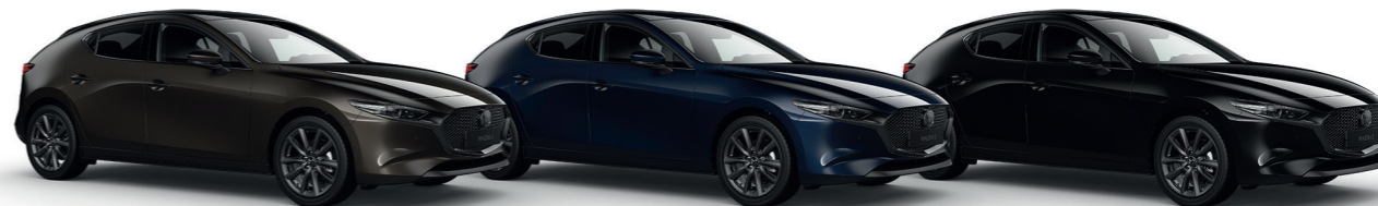
Titanium Flash Mica (42S)