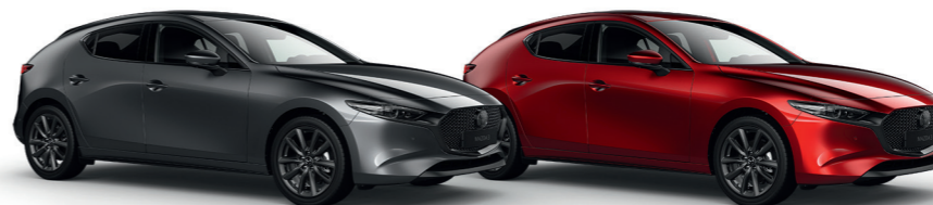
Machine Gray Métallisé (46G)