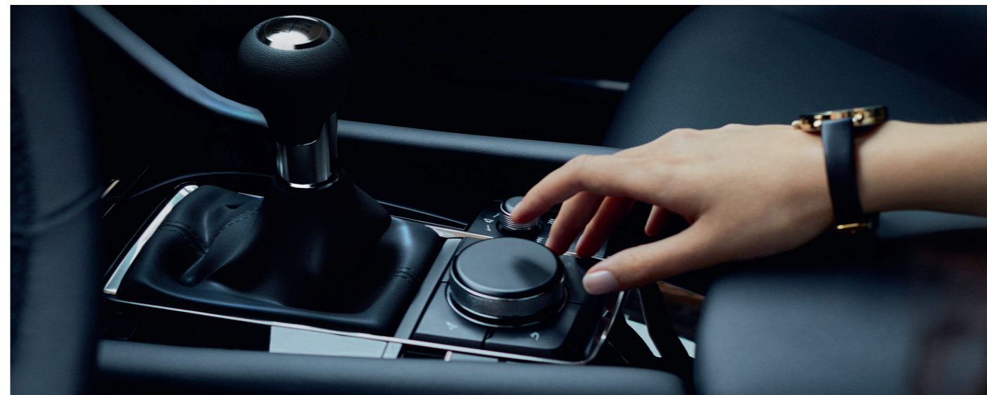
Interface à Commandes Multiples (HMI)

*Tarifs TTC maximum conseillés hors option dans le réseau Mazda au 01/04/2019, sous réserve de changements. Pour toute information complémentaire, veuillez contacter votre Concessionnaire ou Réparateur Agréé Mazda.