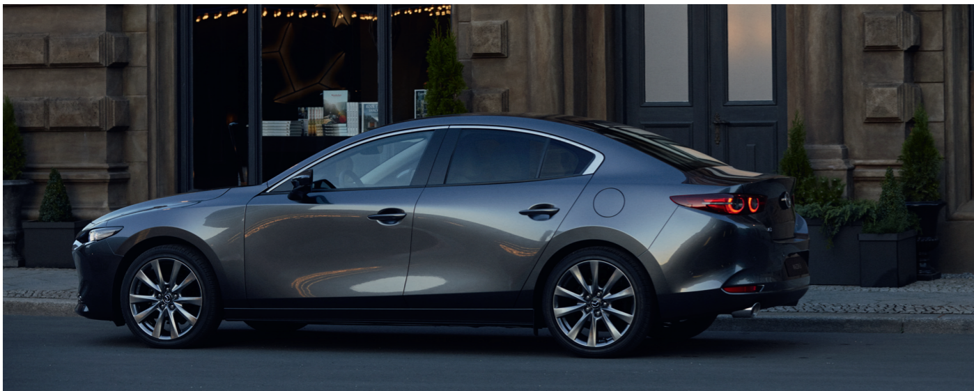
Nouvelle Mazda3 Berline Exclusive avec option peinture Métallisée Machine Gray (disponible en octobre 2019)