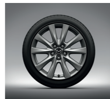
JANTES ALLIAGE 18" « SILVER » (INSPIRATION BERLINE)