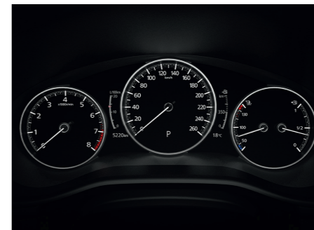
Compteur numérique 7" avec ordinateur de bord couleur