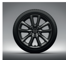
JANTES ALLIAGE 18" « GRAY » (STYLE, SPORTLINE ET INSPIRATION 5 PORTES)

**Seules les zones portantes des sièges (assise, dossier, renforts latéraux) sont revêtues de la garniture mentionnée.